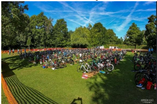
Wechselzone 1: Schwimmen - Rad (Freibad)

In den Wechselzonen muss das Rad geschoben werden, ansonsten droht Disqualifikation. Die Staffeln übergeben in der Wechselzone in einem dafür vorgesehenen Bereich die Startnummer und den Transponder an den nächsten Staffelteilnehmer.