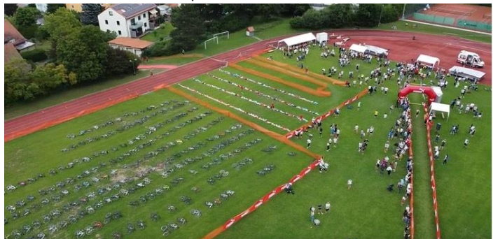
Wechselzone 2: Rad - Laufen (TSH Gelände)